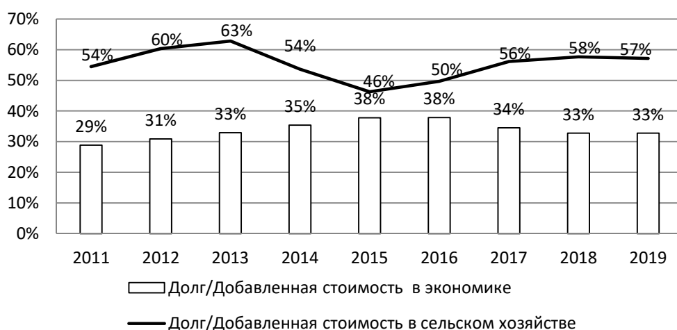
Рисунок 1 – Соотношение среднего объема задолженности по кредитам банков к совокупной добавленной стоимости в экономике и сельском хозяйстве.

Введение. Стимулирование кредитования является ключевым инструментом в рамках решения задачи выхода российской экономики на траекторию динамичного развития. В условиях замедления темпов экономического роста и существования ограничений на привлечение капитала на международных финансовых рынках возросла актуальность развития внутренних источников финансирования. По показателю «кредиты нефинансовым организациям / ВВП» Россия существенно уступает не только развитым, но и целому ряду развивающихся стран (рисунок 1). В качестве источника финансирования инвестиций на кредиты банков приходится всего около 10% (таблица 1). Для сравнения в странах ЕС этот показатель составляет около 18% 1 [30].